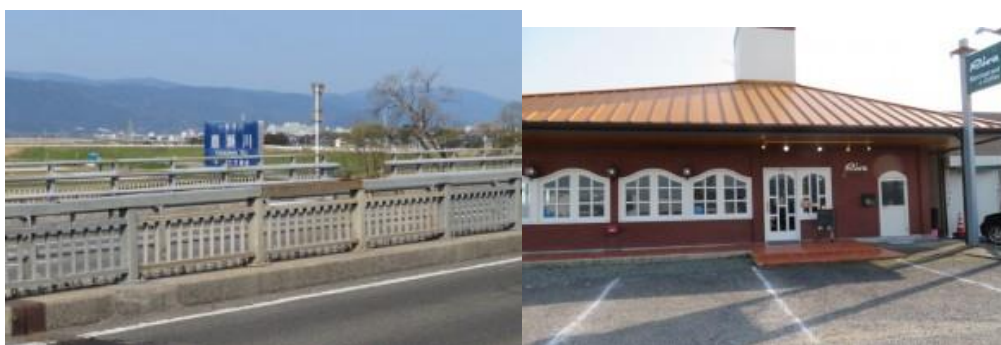
※嘉瀬大橋、レストラン”リーバー”

ご指摘の通り、2つ目の信号のところに鍋島駅への案内があった。暫く歩いた先に信号機があり、鍋島駅への標識があった、それ故、案内頂いた夫妻の両方とも正しいと判明。そんなことを考えているうちに、鍋島駅に16時11分到着する。