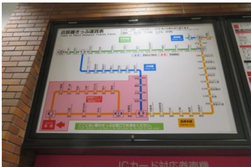
※長崎駅界限の路線図