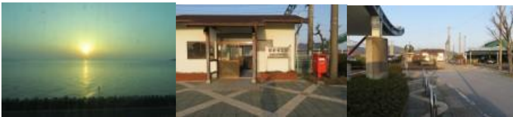
※有明海の太陽、肥前竜王駅