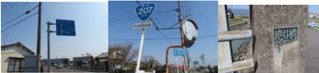
※右往左往した交差点、久保田駅への路、境川橋

④牛津駅から久保田駅まで2.8 kmしかないが、幹線道路が鉄道に沿っておらず踏破には苦勞した。13時7分、西宮社前を通過。牛津駅から少し行った先の交差点で、直進すべきか右折すべきか10分位右往左往する。地理が正しくインプットされていないこともあり、誤って唐津線の小城方面に進もうとする。