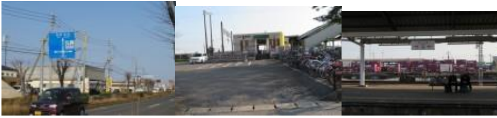
※鍋島駅への路、鍋島駅

⑥16時16分、江頭公民館前を通過。16時57分、神野小学校前を通過。佐賀駅北口には17時6分到着。ホテルでチェックインの後、佐賀駅北口に面した”さかなや道場”で夕食をとり、本日は閉幕となる。