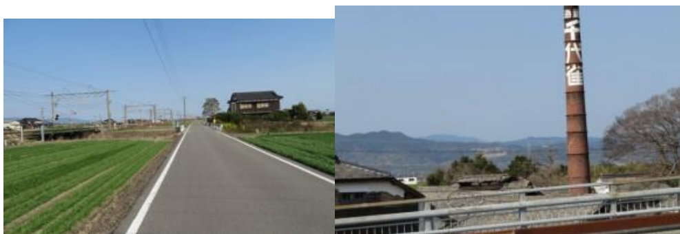
※鍋島駅への路、嘉瀬大橋から見えた酒造”千代雀”

⑤久保田駅と鍋島駅との間にはバルーンさが（臨時）があるが、この駅はパスする。田園地帯を鉄道に沿って歩く。14時33分、JR線下を潜る。14時49分、幹線道路に合流する。14時55分、万歩計で1,010歩ある嘉瀬大橋（嘉瀬川）を渡る。15時15分、遅い昼食をレストランリーバーでとり20分位一息入れる。とても美味しいカツカレーであった。この店を出る際、鍋島駅への道筋をお伺いする。「2つ目の信号を曲がった先にあります」と教えて頂くが、奥様が追っかけて来て、「主人が3つ目の信号と言っています。間違いました。すみません」と。佐賀なまりもある心温まる対応に感動した。