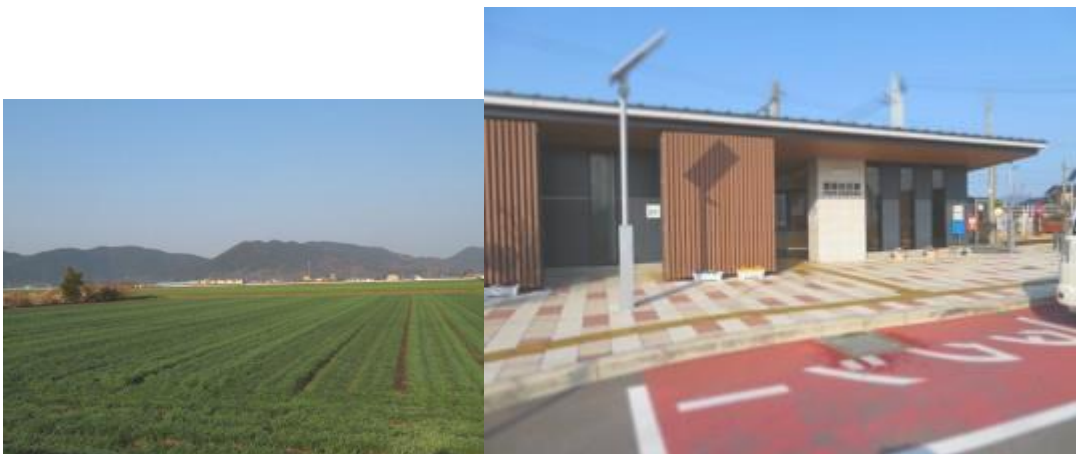
※肥前白石駅への路、肥前白石駅

①8時13分、高島病院前を通過。9時4分、鷹屋神社に本日の安全を祈願する。それにしても日本には神社仏閣が多い。淡々と歩いて肥前白石には9時21分到着。